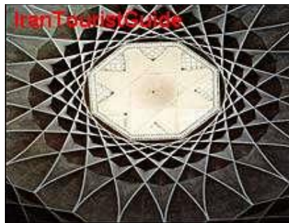
شکل 1-2 یک اثر معماری

گاه برای نشان دادن یک دستگاه، شیء یا رویداد، تنها از عکس می‌توان کمک گرفت. هرگاه جزء خاصی از عکس مورد نظر است، باید به‌گونه‌ای تهیه شود که اجزای فرعی چشم‌گیرتر از جزء مورد نظر نباشد (شکل 1-2).