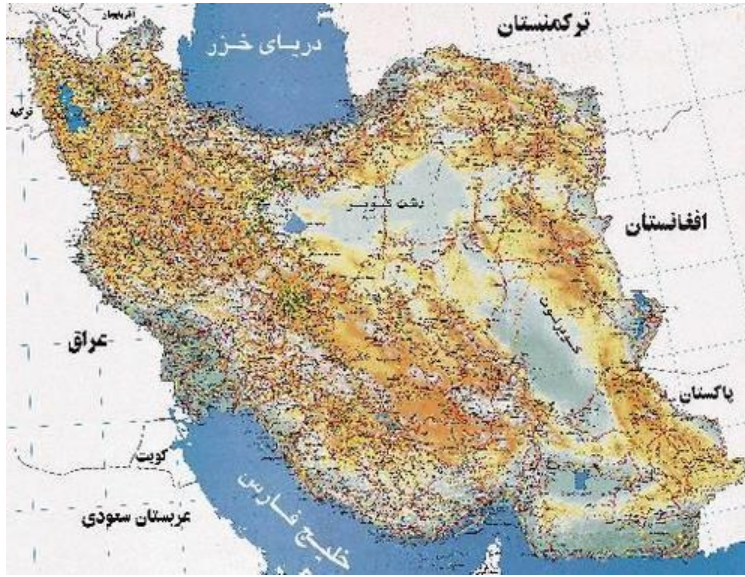
نقشه 1-2 نقشه ایران